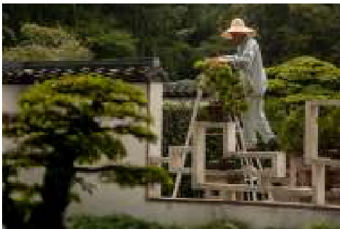
Bonsai beskæres og passes dagligt i Shanghai Botaniske Have.

en kinesisk have kan fint omsættes til danske haver med anlæggelse af stier, som fører rundt i haven f.eks.