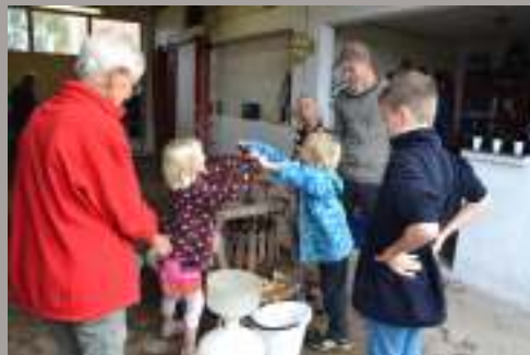
Børnearbejde som i gamle dage