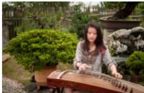
En særlig stemning opstår når der spilles traditionel kinesisk musik blandt træerne.

og med internettets kommunikationsmuligheder er det heldigvis nemt at holde forbindelserne ved lige. Det er også en del af haveglæden. Nu kan jeg se frem til vinterperioden med oplevelser tanket, som måske gør vinteren lidt kortere.