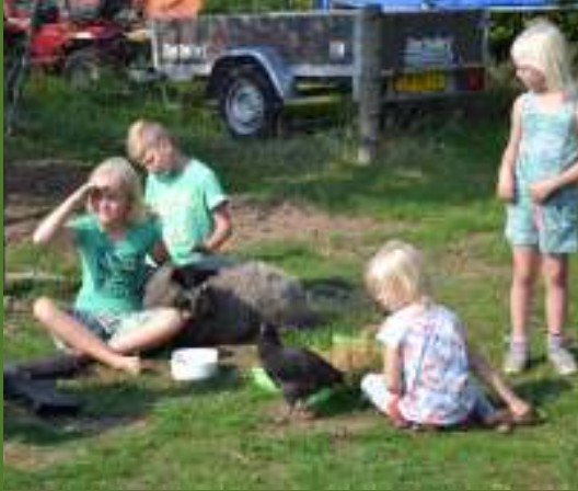
Der var som vanligt mange forskellige dyr på skuet