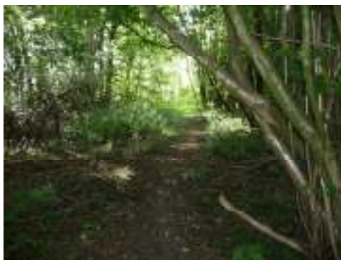
Sti gennem en lille sti, som er meget hyggelig

Man starter fra parkeringspladsen ved Årslev kirke. Den dag jeg valgte, var der højt solskinsvejr. Det var en dag hen på sommeren, hvor kornet stod højt og var næsten klar til at blive høstet. Selve stien er ca. 2 km lang. Den består af et bredt 2 m. græsspor. Der er ikke nogen beplantning langs stien, men hvis man går en tur på dette tidspunkt, så står kornet højt på begge sider af stien. Der er mulighed for at lytte til lærkens sang og se den synge højt over ens hoved. Der skal man lige give sig tid til at stå stille og nyde freden. Stien slår et par sving inden der dukker en lille skov op, som man skal igennem. Der kan være lidt mudret midt i skoven, men sidste gang jeg gik der, var der lagt lidt