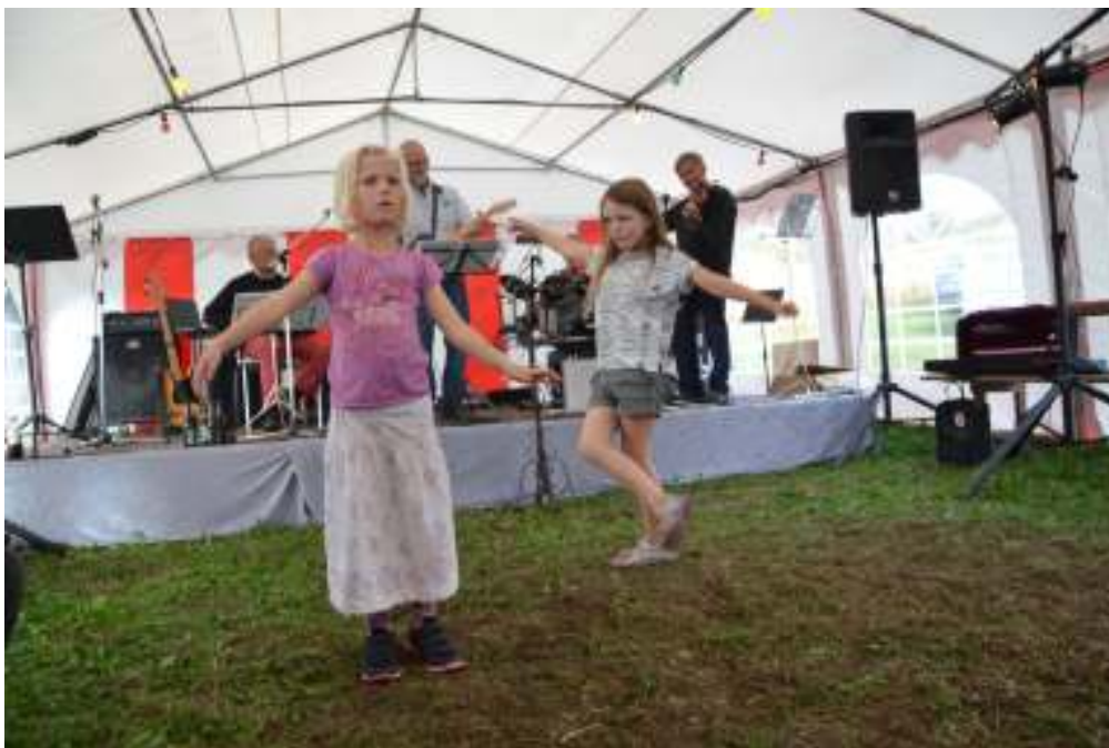
Børn og voksne havde en festdag

Nu blev det så tid til at sætte strøm på in-