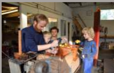
Æblerne bliver hakket