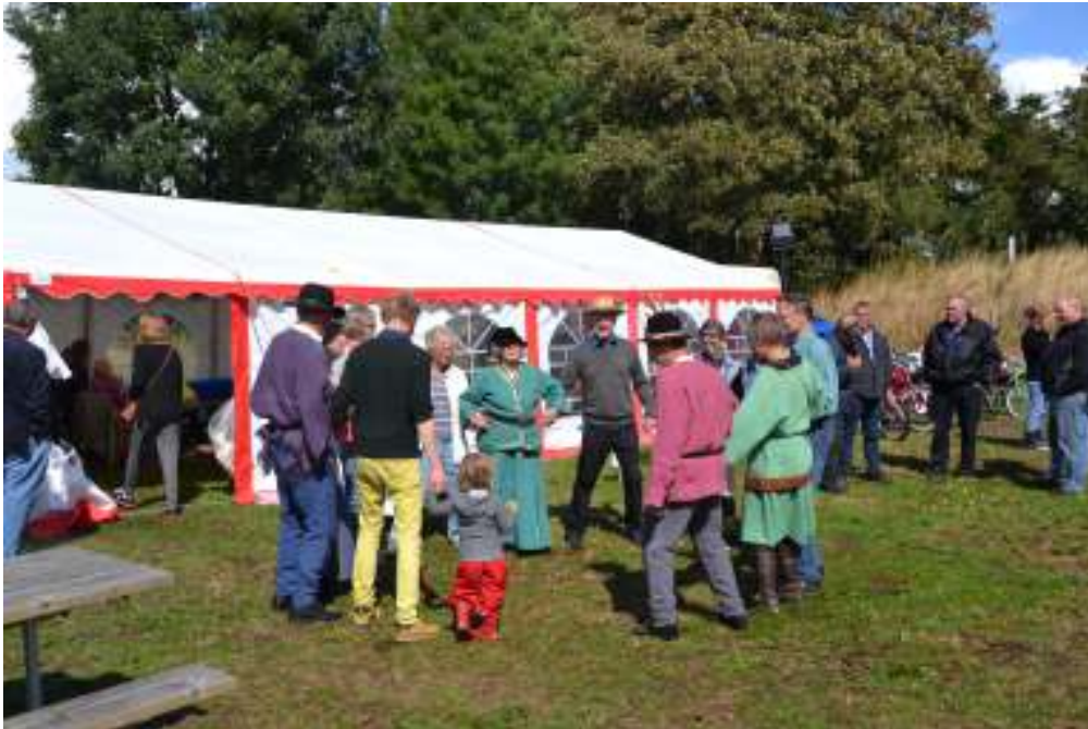
Fokedans på plænen