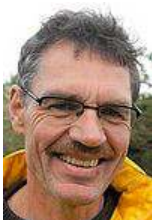
Tekst og foto: Finn Ekelund