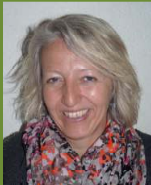
GITTE FYLDER ÅR