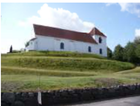
Årslev kirke set fra GI-Byvej

Tæt på hvor jeg bor, er der en gammel, velbevaret kirkesti. Den forbinder kirken i Årslev med kirken i Sdr. Højrup. En sti der kan dateres 150 år tilbage.