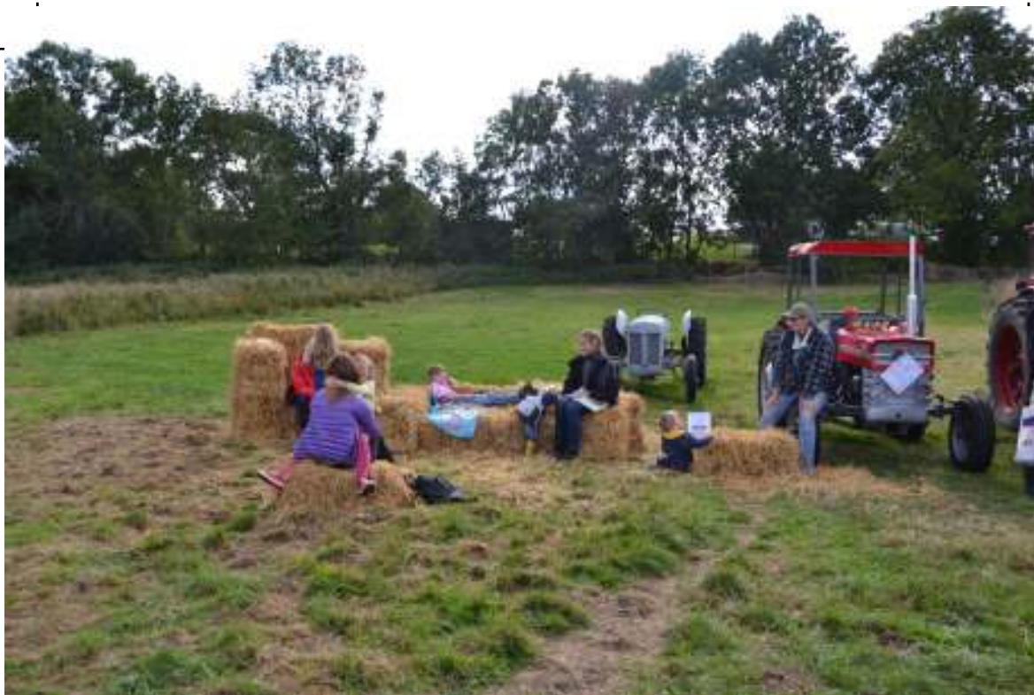
Halmballe tumlepladsen blev flittigt brugt

Ikke så længe efter, nærmere bestemt til et nytårsgilde for nuværende og tidligere Frelstofteborgere, samledes en hel del af bestyrelsesmedlemmerne igen, nu i en udvidet kreds. Også her fik forestillingerne om en festival det bedste frem i folk: So ein Ding müssen wir auch haben! Der kom endnu flere forslag frem, og det blev besluttet, at bestyrelsen skulle sondere terrænet, annoncere festivalplanerne i Fælledbladet og i løbet af foråret indkalde til et indledende arbejds møde, for at