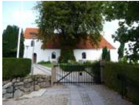
Sdr. Højrup kirke

ministeriet har set på sagen, Faaborg-Midtfyn Kommunes teknik- og miljøudvalg var involveret, Friluftsrådet har set på det, i det hele taget har der været blæst og stormvejr i sagen. Uden at komme for meget i detaljer, så er det endt med at stien ikke kom tilbage til det oprindelige sted. se mere her :