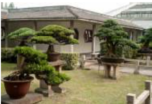
Et par af de mere end 200 udstillede bonsai.

En anden side af havekulturen er de venskaber, der opstår gennem fælles interesse,