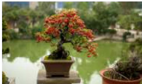
Pyracantha, Ildtorn, med frugter. Trods 27 grader er det efterår i Kina.

og med internettets kommunikationsmuligheder er det heldigvis nemt at holde forbindelserne ved lige. Det er også en del af haveglæden. Nu kan jeg se frem til vinterperioden med oplevelser tanket, som måske gør vinteren lidt kortere.