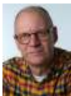
Tekst og fotos: Carsten Reenberg

(Fortsættelse fra sidste nummer af Fælledbladet)