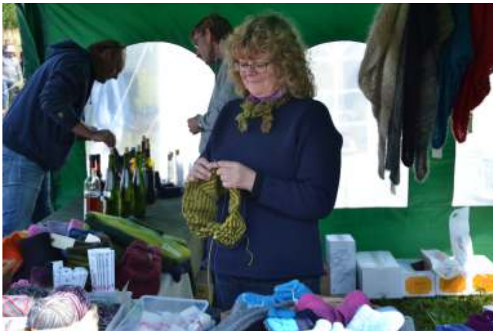
Lokale boder bød på alskens sager