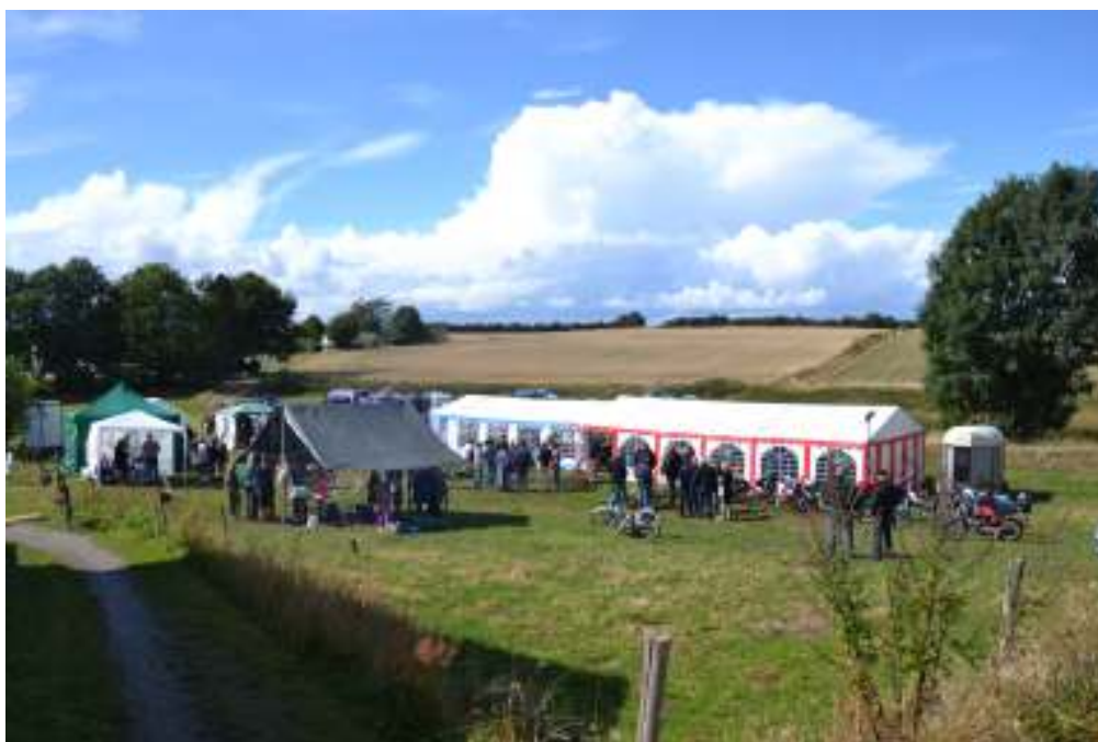
Festivalpladsen i fuld solskin

En rigtig festival skulle det være, med musik, sang og dans, markedsboder og udskænkning af alkoholiske drikke, gamle landsbylege, optog med veterantraktorer, spejderaktiviteter, forskellige workshops, hønsekidningsbanko og andre konkurrencer. Begejstringen ville ingen ende tage, og da vi ikke snakkede om, hvem der skulle være ansvarlige for detaljerne, kunne alt virkelig lade sig gøre. (Jævnfør det gamle ordsprog: ”Intet er umuligt for den, der ikke skal gøre det selv.”)