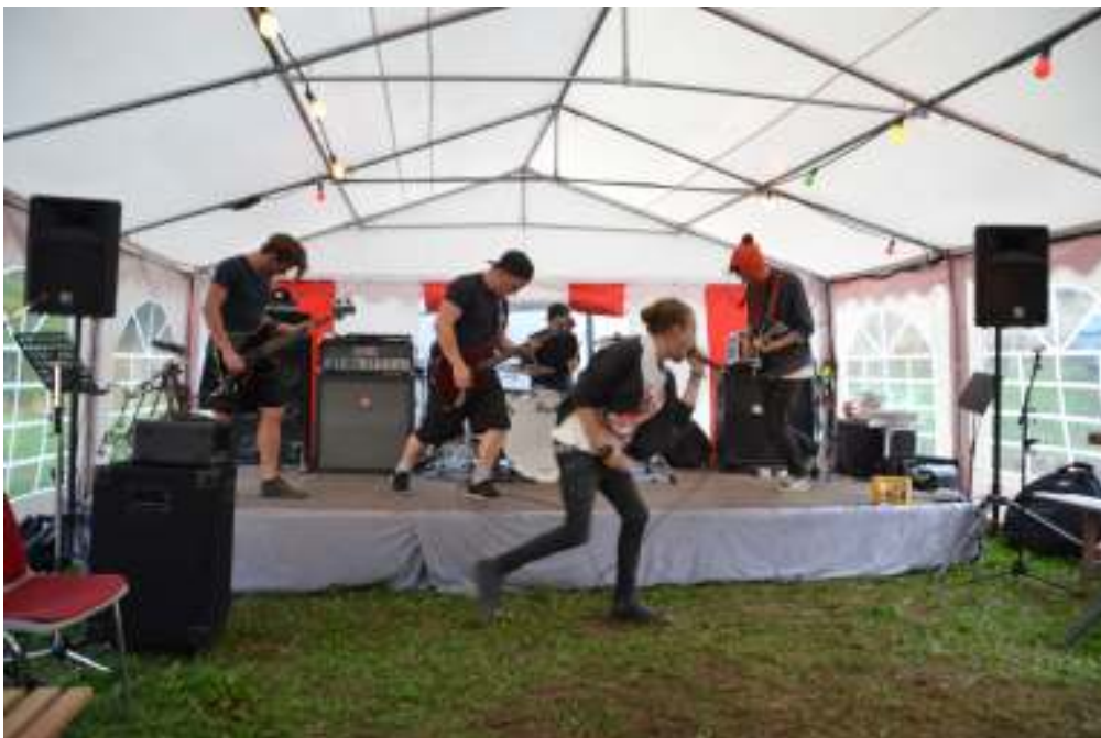
Lidt metal rock fra Out of Autumn satte trommehinderne på prøve