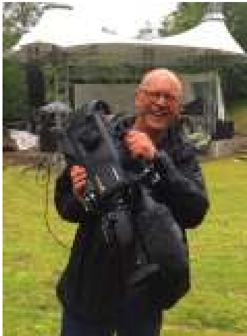
2014. Frisk igen efter kræftoperationerne – på arbejde for TV2 med mit elskede kamera.