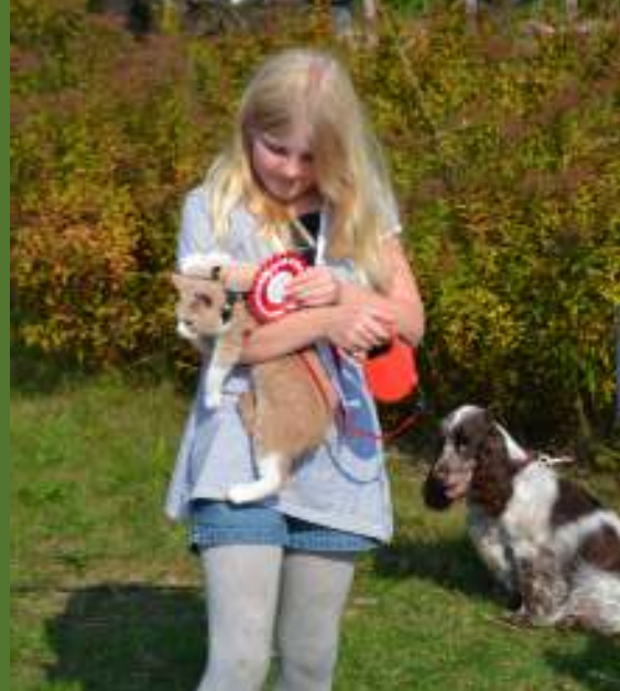
Alle dyr fik en præmie med Fælledens emblem