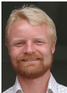
Tekst og foto: Anders Kjær