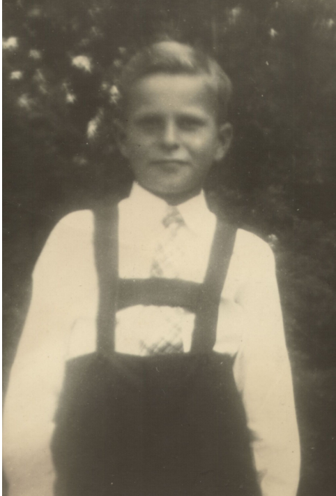
Jersey ca. 1945

dag / søndag, og tage sine søskende med. Hun blev senere ansat som ung pige hos vores nabo.