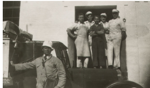
Pederstrup Mejeri 1938 Henrik nr 2 i døren fra venstre.

Da ejendommen på Ellebjergvej ligger tæt