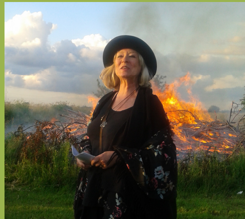
SCT. HANS AFTEN