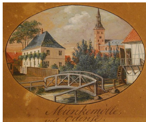
Munke Mølle i Odense, som lå ved enden af H.C. Andersens barndomsgade