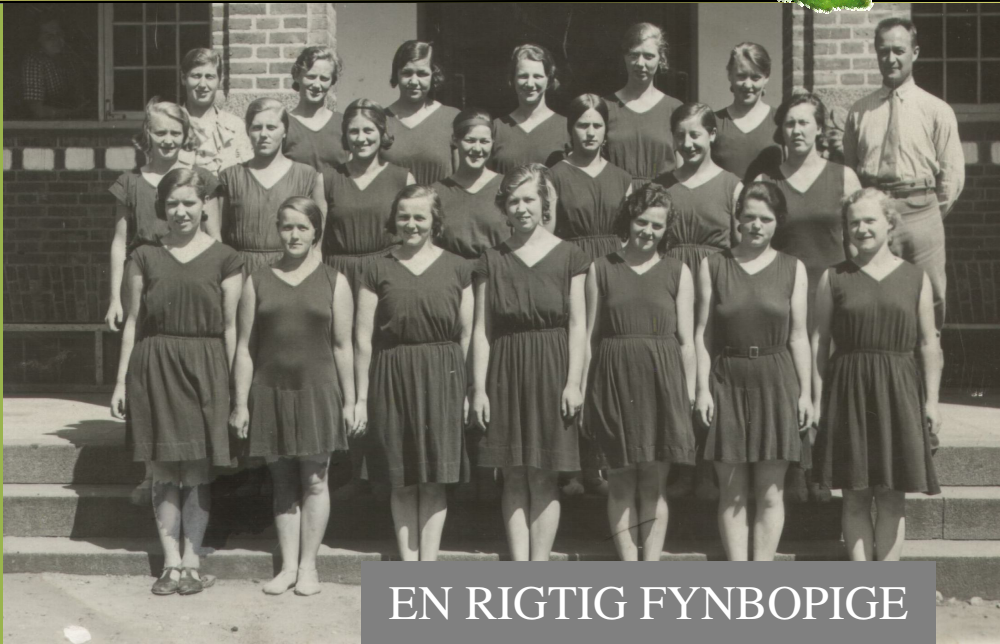
EN RIGTIG FYNBOPIGE