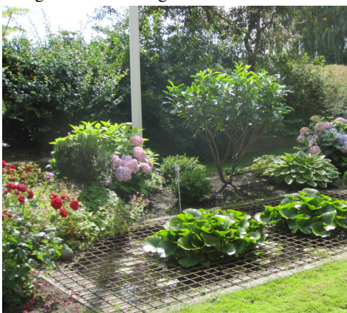
Havebassinet er sikkert for børnebørnene, og giver en dejlig rolig stemning i haven.

Og der er ikke nogen tvivl om at de sidste