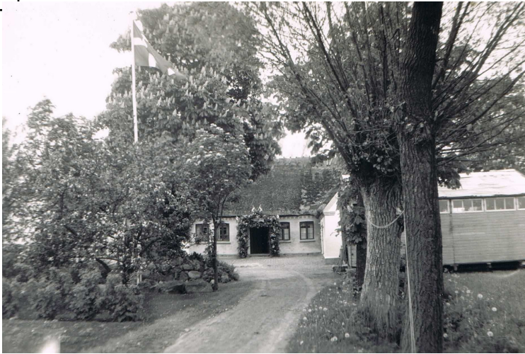
Indkørsel til ejendommen på Søstedvej. Der er rejst træhus i anledning af sølvbryllupet.