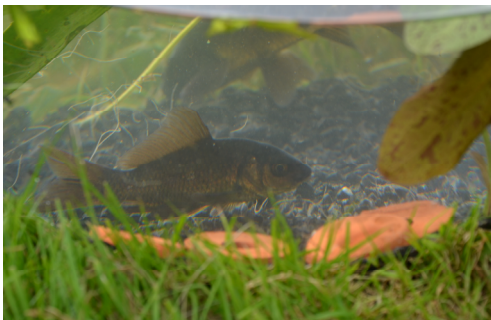
En lille fisk havde fundet vej til dyrskuet.

Der var mødt ca. 40 op til årets børnedyrskue, og vejret var strålende. Med de mange aktiviteter, mindede dyrskuet i år meget om det, der tidligere er beskrevet fra 60-ernes Freltofte.