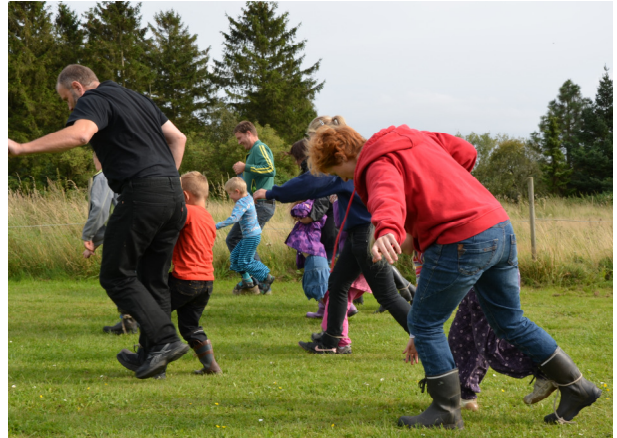
Trebensvæddeløb i fuld firspring.