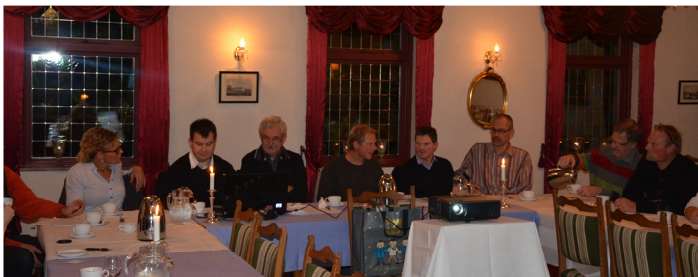
Den siddende bestyrelse