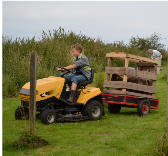
Geden køres hjem igen med tak for i dag.