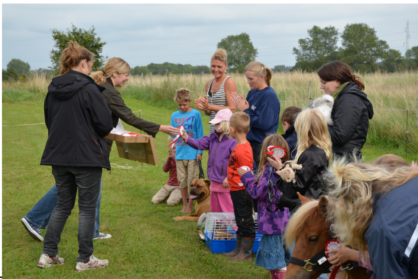
Der overrækkes præmier til de mange deltagere.