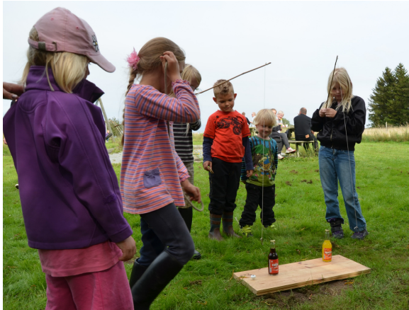
Det er ikke helt så let, som det ser ud til.