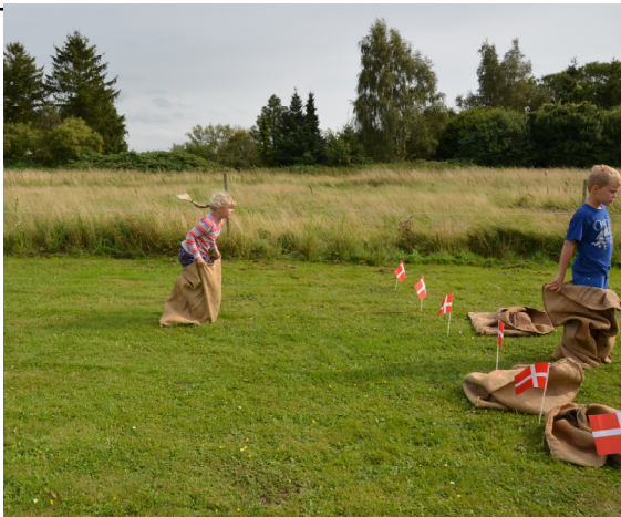
Fuld fart over feltet ved dagens konkurrence i sækkevæddeløb.