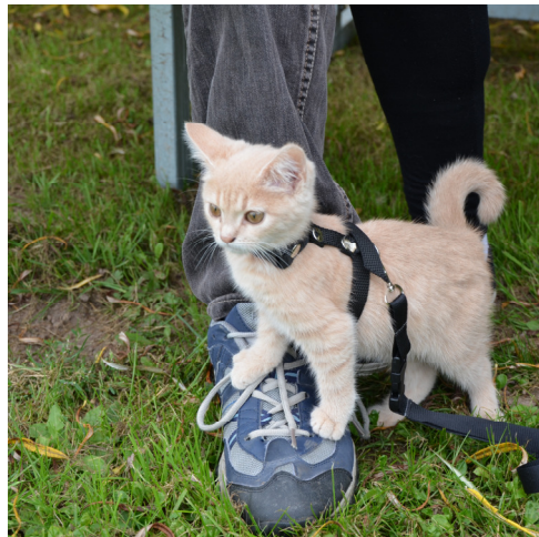
En meget veldisciplineret killing.