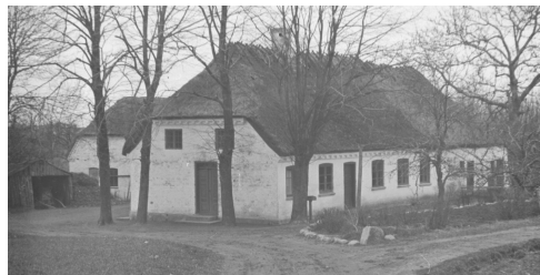
Barndomshjemmet på Grønmossevej.