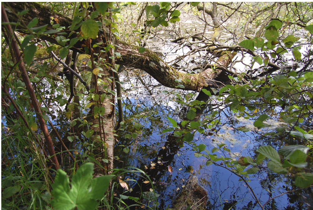
Der er idyllisk ude på mosen; men det kan være svært at få en line i vandet, endsige få den op igen med en fisk på.

Måske er både cykelturens længde, fiskens størrelse, det åbne vands areal overdrevet i min erindring, men for mig står det som det vilde vesten, selv om det altså snarere burde hedde sydens vildmark. Gedde! Ja, jeg husker, at jeg vovede, da den var halet på land og lå der i græsset, at berøre snudepartiet. Den åbnede gabet for sidste gang, og jeg trak fingrene til mig. Magen til sylespidst tandgebis havde jeg ikke spor lyst til at stifte nærmere bekendtskab med. – Jeg tror, det også lykkedes denne gang at sige fra med hensyn til fiskefrikadeller, men på 1. sal påstod man,