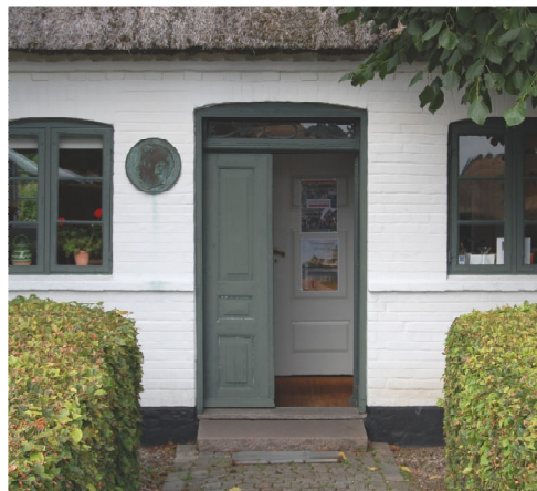
Indgangen til Carl Nielsens barndomshjem.

I byen opdagede han, at når han længtes efter markerne, huset og sin mor, blev tonerne ligesom højere inde i øret på ham, høje og klare som et fynsk forår. En anden ting han opdagede, som tiden gik (det havde lange Hans Christian opdaget mange år før) var, at papir må der til, hvis andre skulle have glæde af det, der strømmede, og det var, hvad han ville. Også at det ikke var lige meget, i hvilken rækkefølge ord og toner flød, at man kunne få mennesker til at føle noget, til at le, græde, ligefrem elske, når ord og toner kom