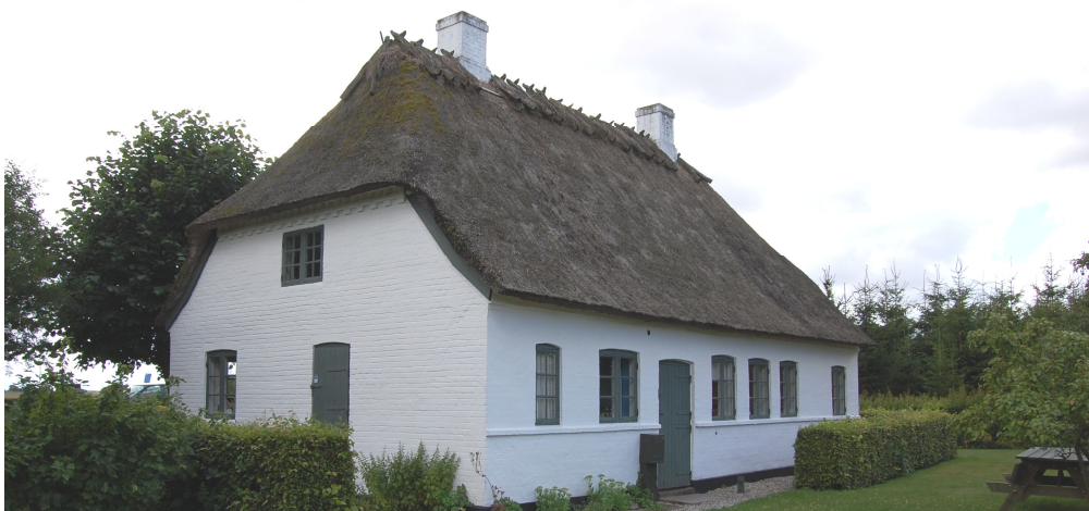
Carl Nielsens barndomshjem set fra havesiden.