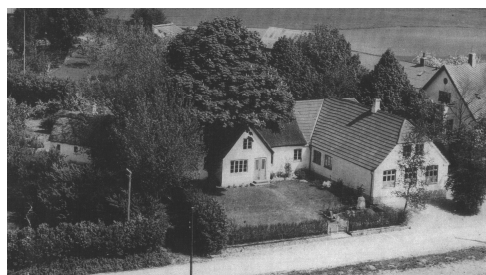
Palleshave Friskole ca. 1950