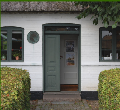
CARL NIELSENS BARNDOMSHJEM