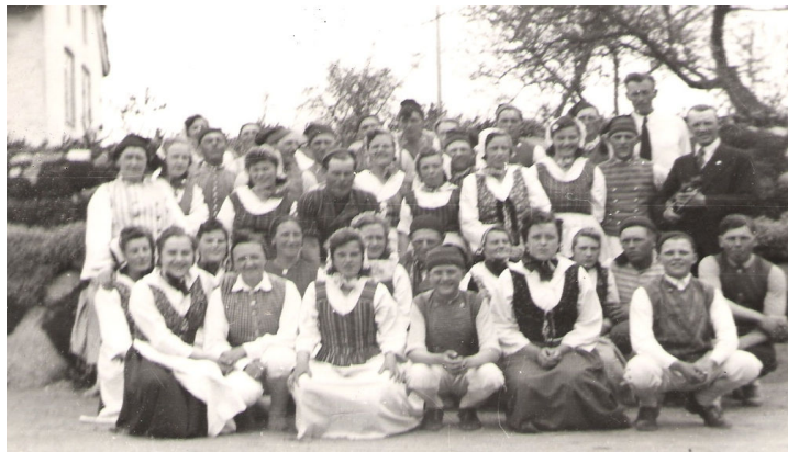
Folkedansere i Nr. Lyndelse Gymnastikforenings regi, fotografet ved stengærden foran Freltoftevej 31, ca. 1946-47. Gymnastikforeningen benyttede flittigt sognets forsamlingshuse.

Som nævnt i forrige nummer, blev jordstykket mellem huset og bækken tilkøbt til parkeringsplads, og der blev lavet en tilbygning mod vest, med indgangsdør, garderober og toiletter, en trappe op, og ny scene afskærmet af et gelænder, der kunne fjernes når der skulle spilles dilletant. Indvielsesfesten blev afholdt samtidig med høstfesten den 29 sept. 1953.