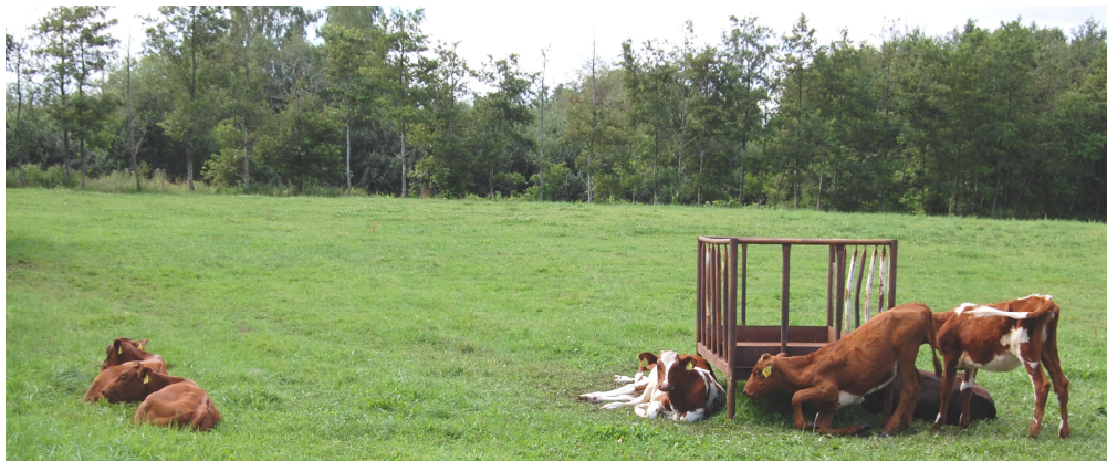
Kvæget nyder det gode vejr og freden på mosen.