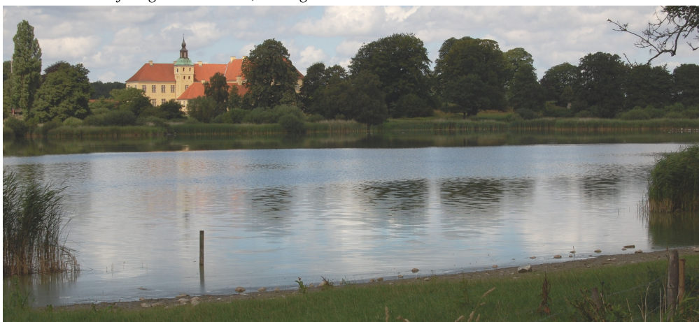
Pigernes badeplads ved søen, med Søbysøgård i baggrunden.