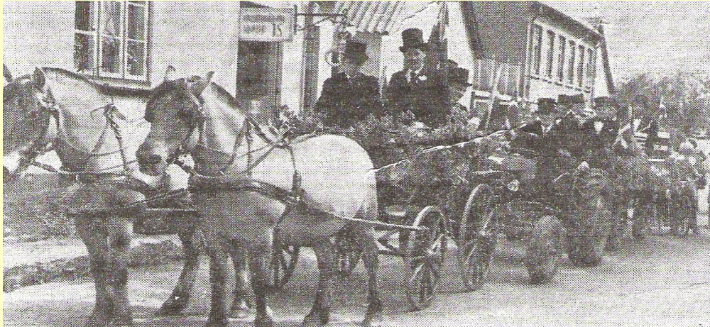
Desværre kunne originalbilledet ikke findes, så derfor dette lidt uskarpe fotokopi fra et avis-Udklip, som viser optøget gennem Freltofte, ud for bageren og købmandsforretningen.