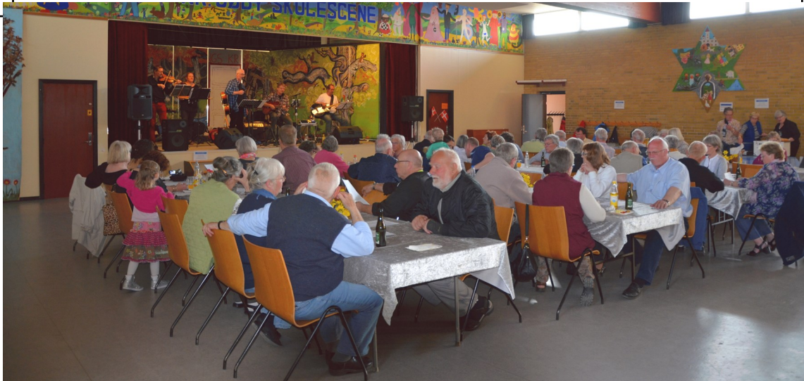
En velbesøgt afslutning i Regnbuens aula. Det er desværre ikke muligt her at gengive musikken, men den var absolut værd at lægge øre til.