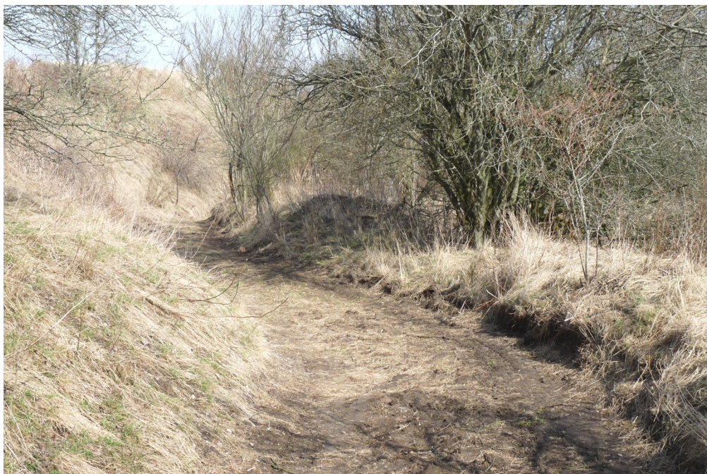
Adgangsvejen er igen farbar.