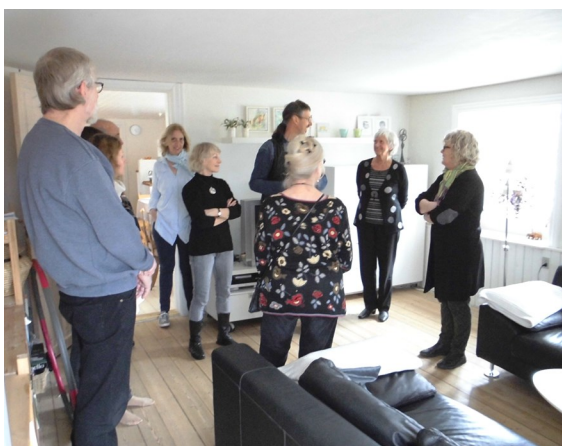
Ole fortæller om renovering