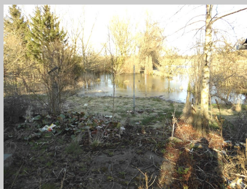
Haven bag Freltofte Smedie

ret. Huset vil i den nærmeste fremtid blive klargjort til salg således at der kan flytte nye beboere til vores område.