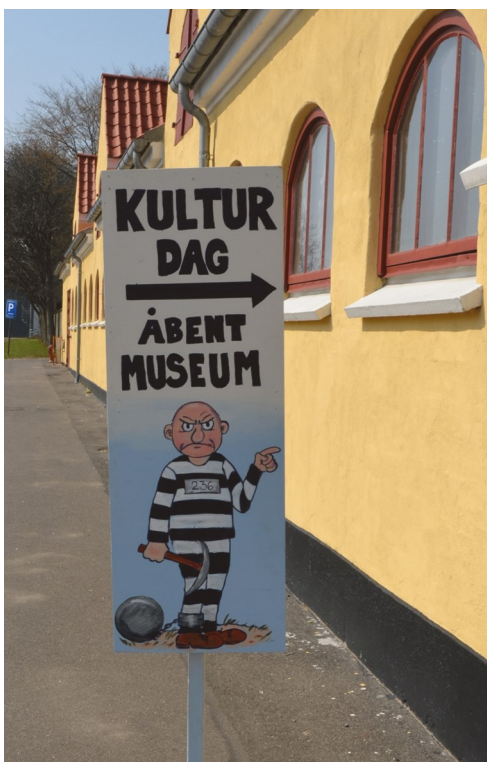
En spjældkandidat viste vej til museet.

Lørdag den 4. maj 2013 blev der afholdt kulturdag i tidsrummet kl. 14-17. Der var fælles afslutning i aulaen hos børnehuset Regnbuen på Røjlevej 22, med bandet Irish Coffée.