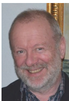
Tekst og foto: Peter Albrekt