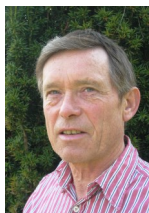
Tekst og foto: Aage Spejlborg Hansen

Når jeg går fra Freltofte og ud af Birkebjergvej kigger jeg altid op til den markante gule bygning, der i tidligere tider var ramme om den lokale mølleindustri. Det er Birkebjergvej 1 som i daglig tale omtales som møllen. Der har tidligere i dette blad været beskrivelser af møllens historie, men hvordan mon tilværelsen er for de nuværende beboere?