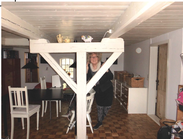
Bærende stolper i kornmagasinet