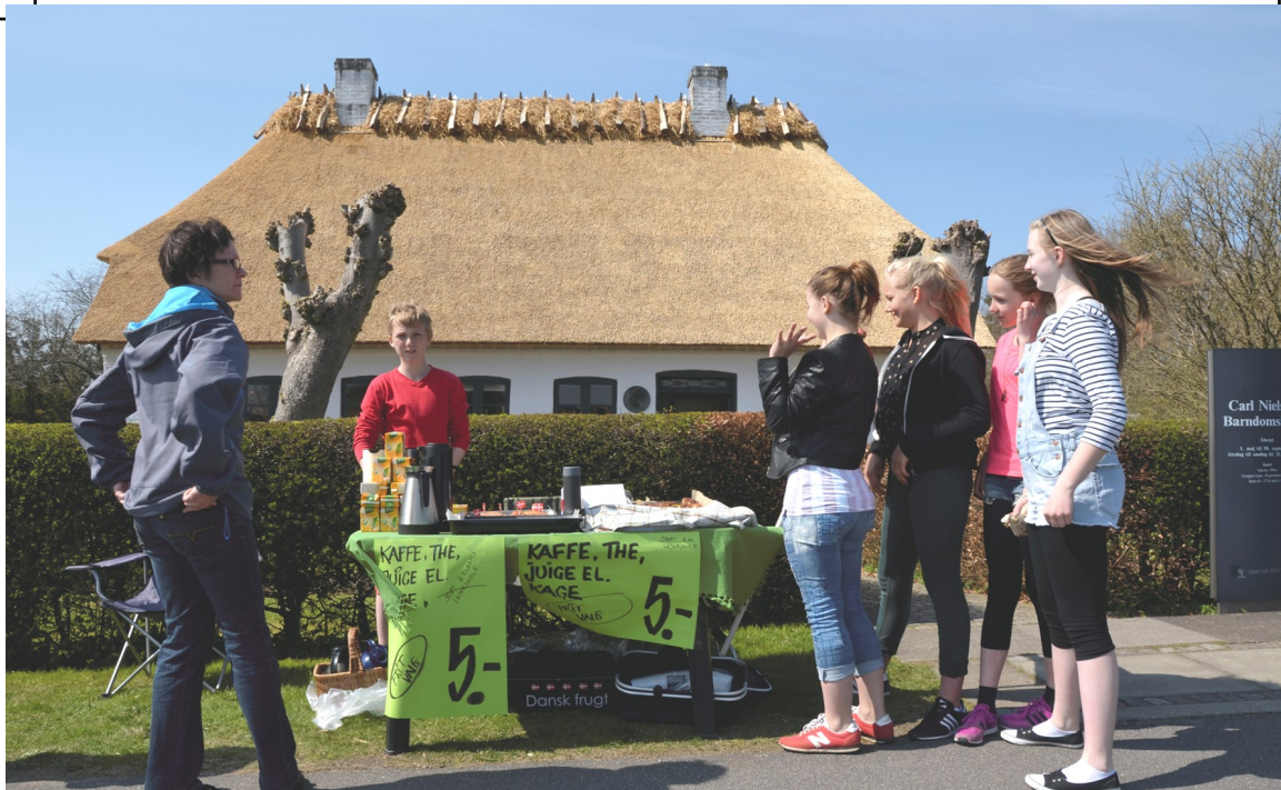
Eleverne i 6. klasse havde været så fornuftige at benytte dagen til at skaffe sig lidt støtte til lejrskolen. Et godt initiativ og nogle veloplagte elever, der fortjente den støtte de kunne få.

Tidsrejsen ved Nr. Lyndelse Kirke havde også god tilslutning og publikum kvitterede med klapsalver som tak for oplevelsen. Der var ca. 30 deltagere i tidsrejserne, så meldingen lyder, at det gerne må gentages.