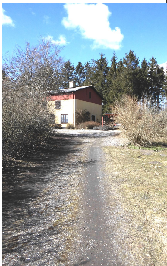
Freltofte Gl. Mølle

hvad der foregår deroppe. Jeg blev derfor rigtig glad da Lone og Vagn Åberg indvilgede i at fortælle lidt om deres liv og virke.