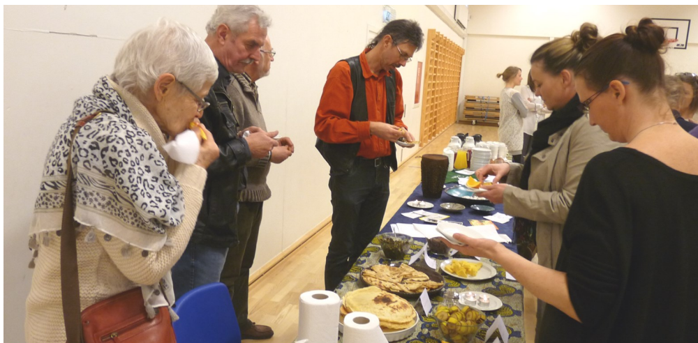
Smagsprøverne blev nydt af de fremmødte

smagsprøver på de retter, som de havde lært at lave under opholdet.