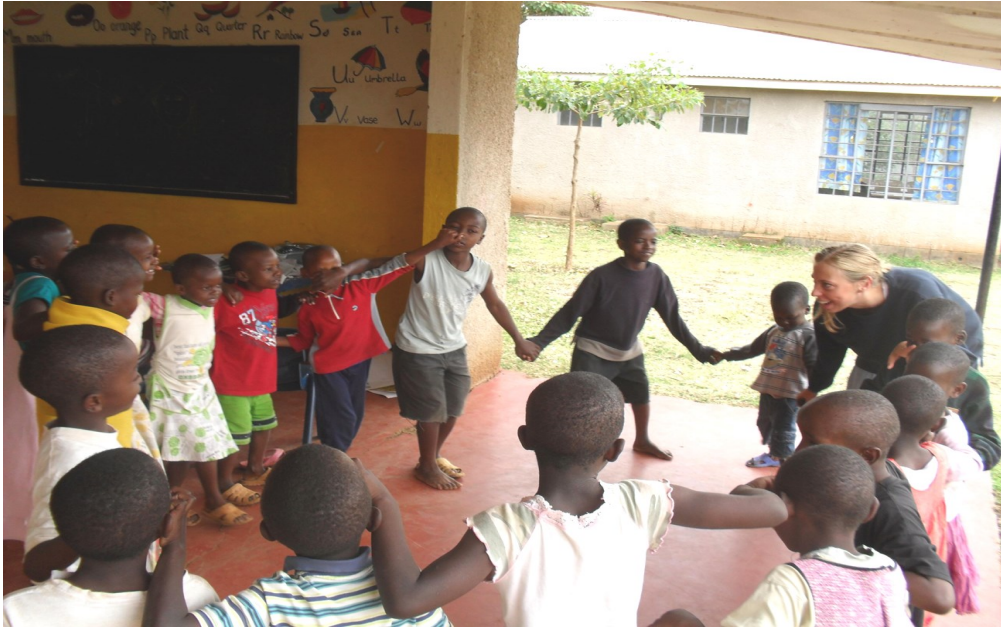
Dans, sang og leg indgår som del af undervisningen