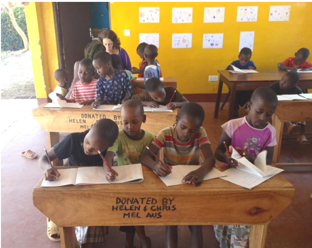
Koncentrerede elever i "afternoon school"