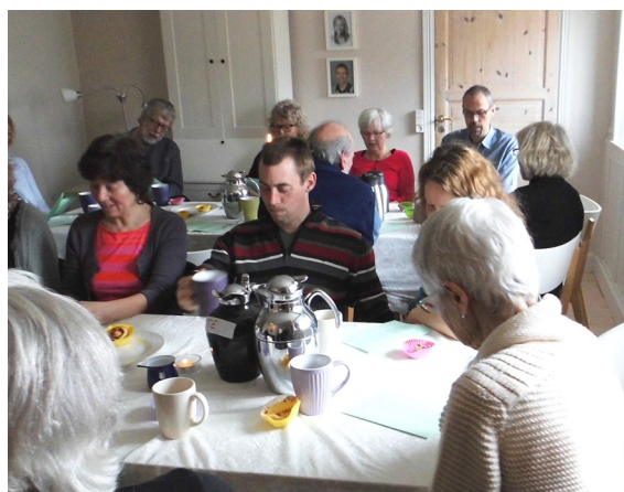
Ole og Gittes stue