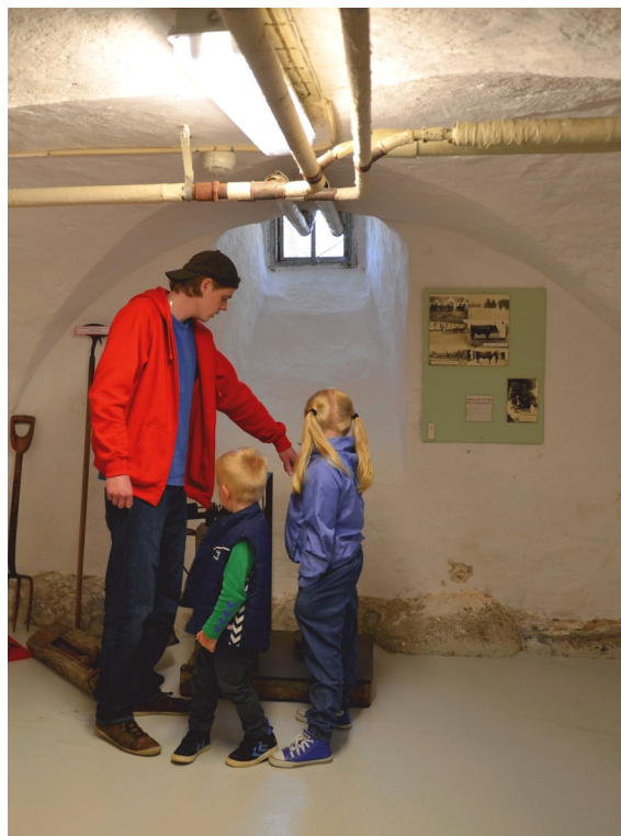
Fra fængselsmuseet. Det giver en rigtig god oplevelse, når man er sammen med en engageret fortæller

Også konfirmandstuen i Nr. Søby var i dagens anledning lukket op, og de besøgende blev budt på kaffe, hyggesnak og besøg i kir-