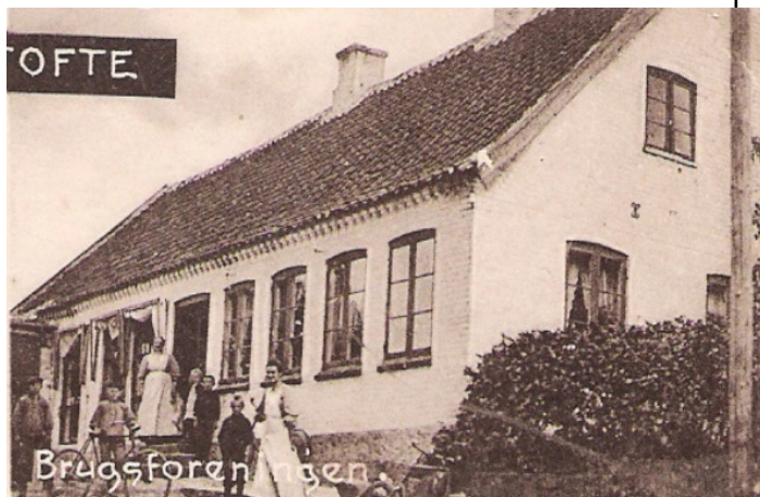
Freltofte Brugs, ca. 1919.