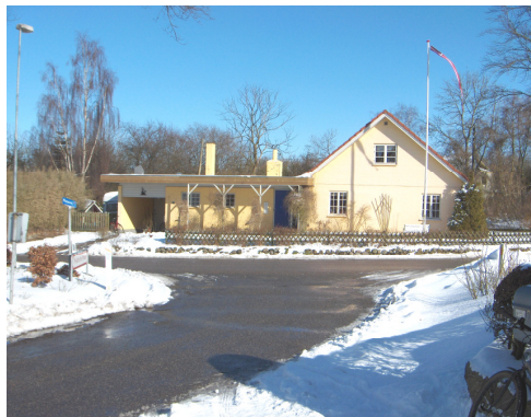
Freltoftevej 39 er centralt beliggende i Freltofte. Området her, med det skarpe vejknæk gennem byen, kaldtes førhen for stævnet, og her lå netop landsbyens smedje. Nuværende hus er opført 1890.

hver gård fik jorden samlet i egne enemærker. Det var en radikal ændring af kulturlandskabet og bebyggelsesstrukturen, som sikkert ikke er forløbet uproblematisk ved fordelingen af jorden. Ændringer af hegn og grøfter. Vejforløbet til og fra landsbyen blev ændret. Før fulgte de landskabet naturlige veksler, nu blev der trukket nye lige linjer med linealen, ejerlavsgrensene blev justeret, og ved de flydende grænser ved overdrevene, blev der trukket lige linjer, b. la. ved Bregnebjerg mellem Freltofte og Sdr. Højrup. Idealet var en egentlig ophævelse af landsbyerne, hvor gårdene blev spredt ud over hele landskabet. Det var ikke en udvikling bønderne ønskede. De så med mistro på øvrighedens ønsker, og ingen ønskede at bo uden for landsbyens trygge rammer. Den gamle landsbystruktur forhindrede udvikling og vækst, og dermed indtægt til landet.