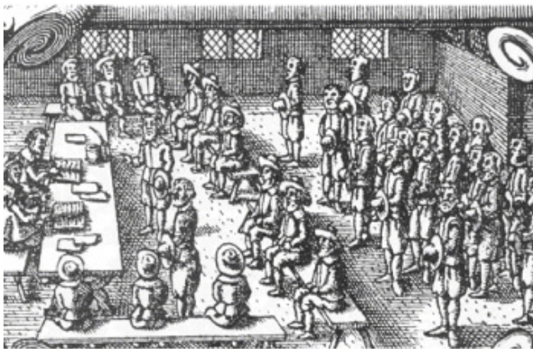
Herredsting i funktion, fra titelbladet til Christen Ostensen Veyle: "Glossarium Juridico Danicum", fra 1652. Ved bordet sidder herredsfogeden (med hat) og tingskrivere. Foran bordet står sagens parter. Siddende ses de 12 tingsmænd. I Åsum optrådte Freltofte bønderne ofte samlet som tingsmænd. Bagved står tilskuere fra herredet.

Forten, det fælles gadeareal er skrumpet ind til en vej, og har afgivet jord til skoler og forsamlingshus, men slyngningen af vejen gennem byen, gadekæret, og flere af gårdtøfterne er velbevarede, skabt for 1000 år siden.