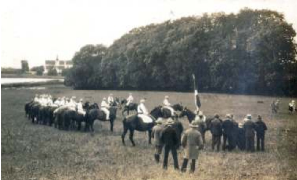
Ringridning i Nr. Søby ca. 1924. Søbysøgårds spir ses i baggrunden.

en stor forsamling flokkede sig deromkring som tilskuere. Ringriderne var gerne iført hvide benklæder, og både karl og hest var smykkede med blomster. Karlene stak efter ringen med lange lanser og drengene med korte pinde. Hver gang ringen blev taget, spillede musikanten et stykke på trompeten. Den der først tog ringen tre gange, kaldtes konge og tog den første gevinst. Den der havde taget ringen to gange, fik anden gevinst og var prins. Stodderkonge blev den, der slet ikke havde fået ringen. Kongen red nu lidt til siden og blev pyntet af pigerne. Derefter red det hele tog parvis med kongen i spidsen og de øvrige efter rang omkring i byen til præsten og gårdmændene, hvor de fik gaver til deres gilde og blev beværtede med æbleskiver og brændevin. Gildet stod i en af gårdene. Spise og drikke var tvebakker, risvælling og æggecake med øl og brændevin. Kongens dame var dronning, og dansen gik til den lyse morgen. Det er denne gamle, folkelige skik, der har udviklet sig til de store ringriderstævner i Sønderborg og andre steder, og som nu efterlignes af unge raske karle landet over.”