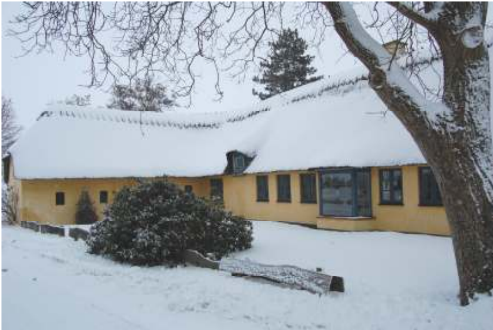
Søstedvej 15 - Februar 2010