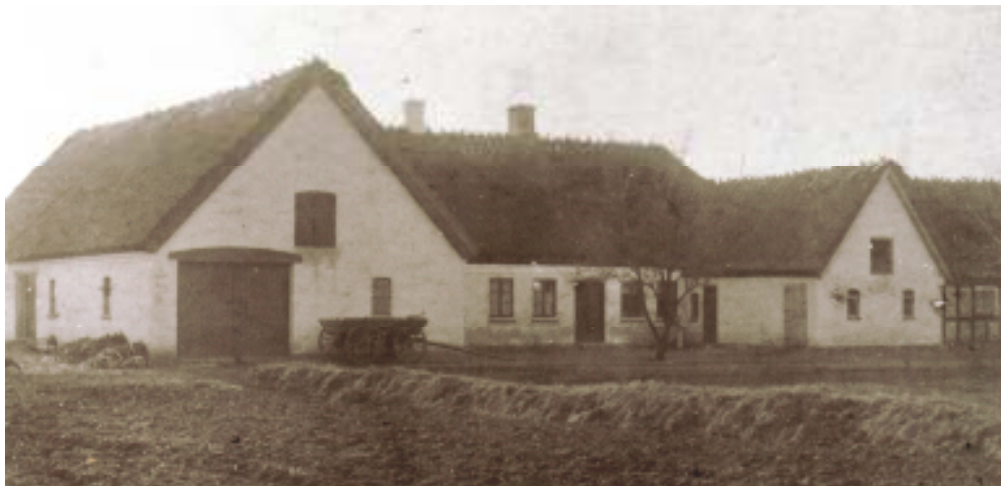
Søstedvej 18 - ca. 1930