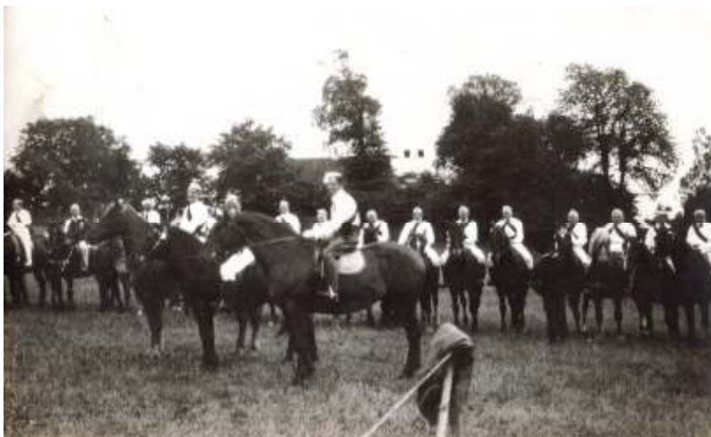
Ringridning i Nr. Søby ca. 1924. Kirken ses i baggrunden.

Det spørgsmål løb ind i min mailboks, og sådan et spørgsmål har jeg svært ved at ignorere. Så – ved at rode i den gamle ”kramkiste”, konsultere nogle bøger + arkivets billedskat kom jeg frem til RINGRIDNING . Det husker jeg også lidt om fra min barndom.