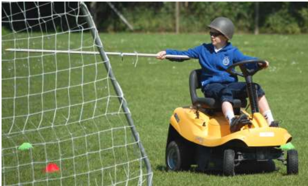
Ringridning anno 2009. Stedet er det samme, men tiden en ganske anden.