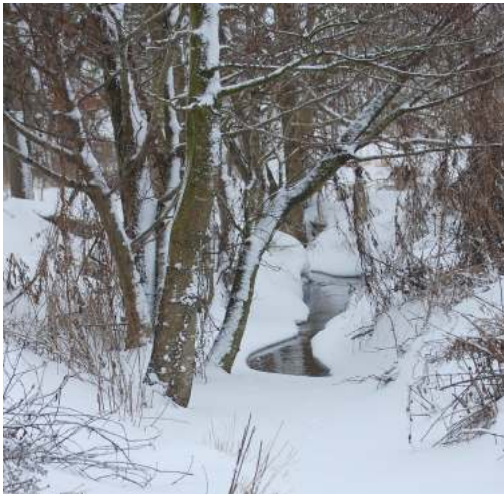
Bækken mellem Søstedvej 17 og 19