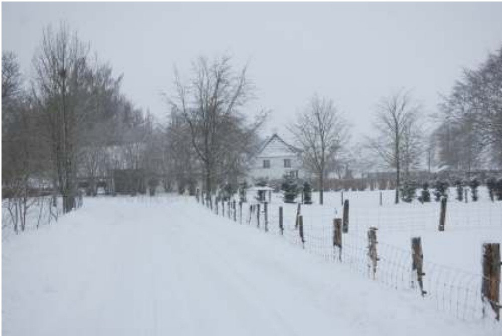
Søstedvej nr 3 - Februar 2010