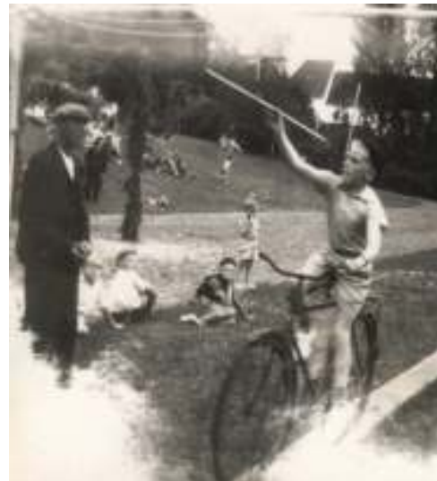
Ringridning på cykel. Ca. 1950.

I Nørre Søby har der også været ringridning. Den tidligste, vi har billeder og omtale af, er fra 1924. Det foregik på ”Sportspladsen”, som dengang var en stor græsmark. Iflg. en avisomtale i Fyns Venstreblad fra 29. juni 1924 var Ringriderfor-