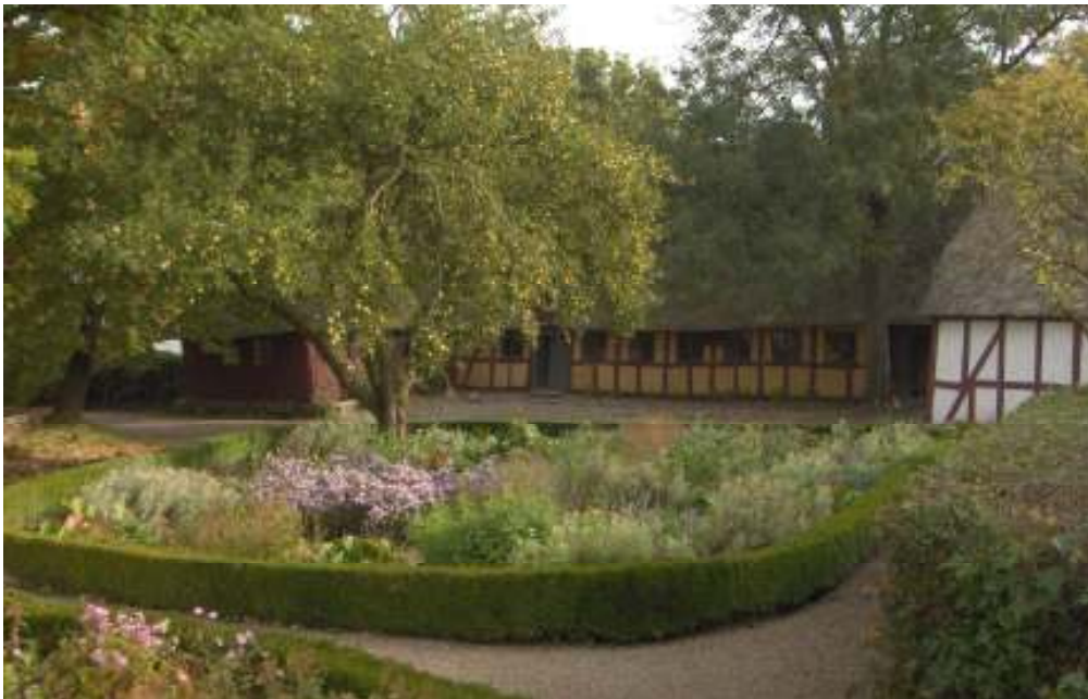
Fjeldstedgårdens prydhave i Den Fynske Landsby. I baggrunden Sortebro Kro.