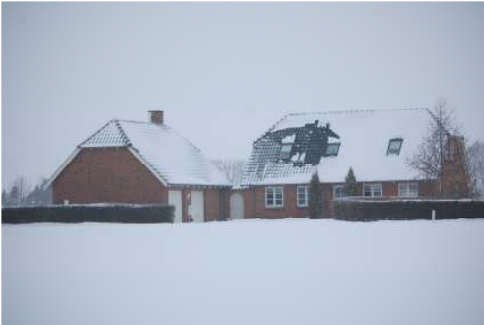
Søstedvej nr 13 - Februar 2010

Efter grusgravningen blev området ved Peder og Kruse jævnet ud, mens det inde ved Karl og Elvina blev liggende urørt. Efterhånden groede vandhullet til, og der kom en stor bestand af strandtudser. Ligeledes var der nogen, der udsatte karusser.