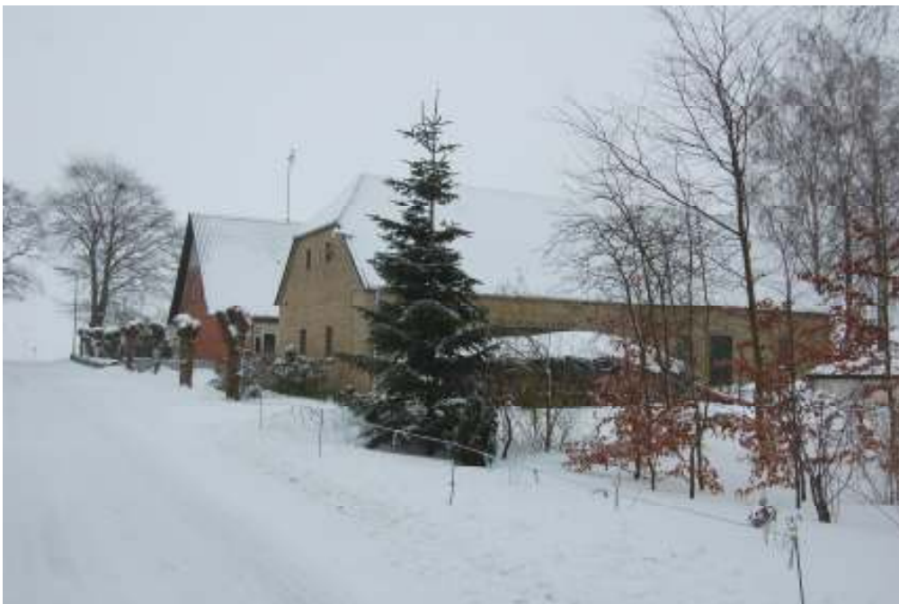
Søstedvej nr 12 - Februar 2010