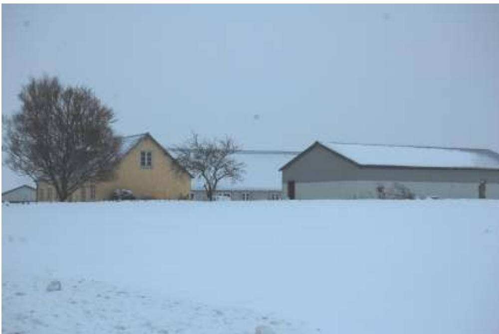
Søstedvej 16 - Februar 2010