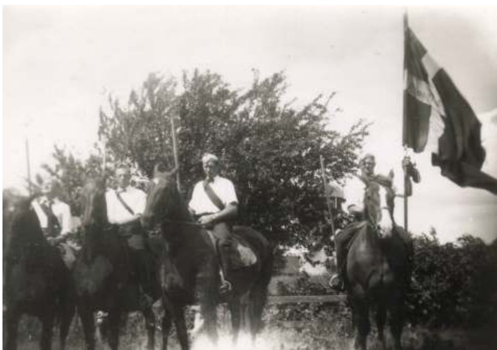
Ringridning i Nr. Soby. Ca. 1950