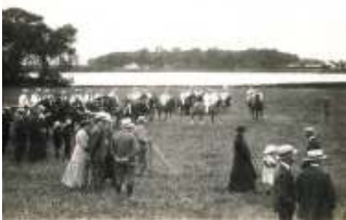
Ringridning i Nr. Søby ca. 1924. Søbysøgård ses i baggrunden.