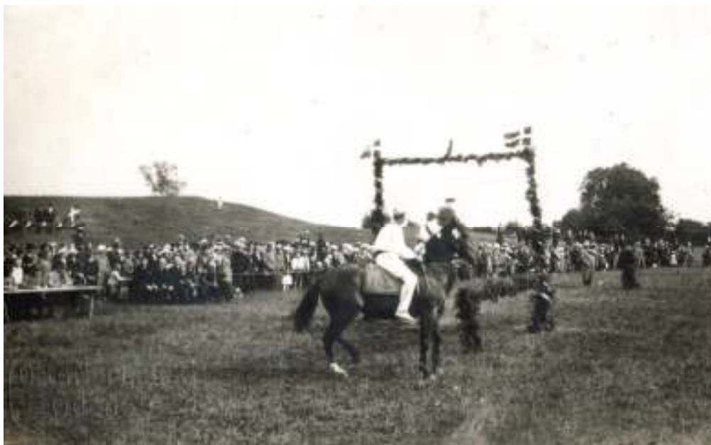
Ringridning i Nr. Soby. Ca. 1924