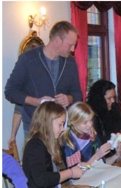
Juleforberedelser - julen 2009

Vi er imidlertid taknemlige for det arbejde han har udført i gennem årene for Freltofte Fælled som senere blev til landsbyforeningen Fælleden. Endvidere har vi haft stor glæde af hans mange fine lokalhistoriske artikler i Fælled Bladet, som han siden 2008 også har