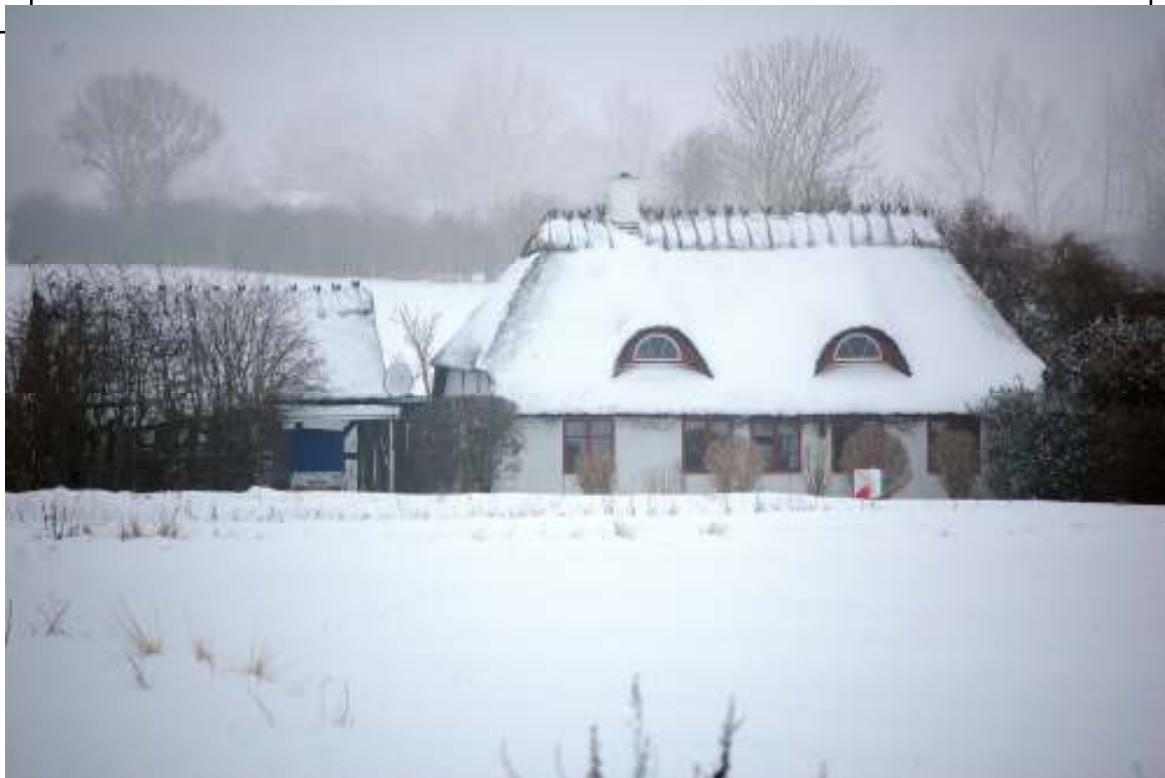
Søstedvej 1 - februar 2010

pede vand op til kreaturerne; jeg husker møl- len og vandtruget.