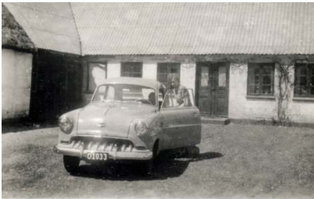
Søstedvej 19 - ca. 1950